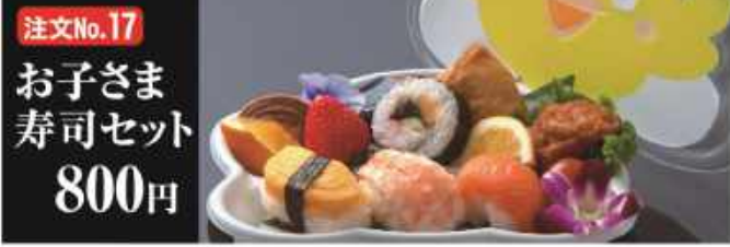
注文No.17 お子さま 寿司セット 800円