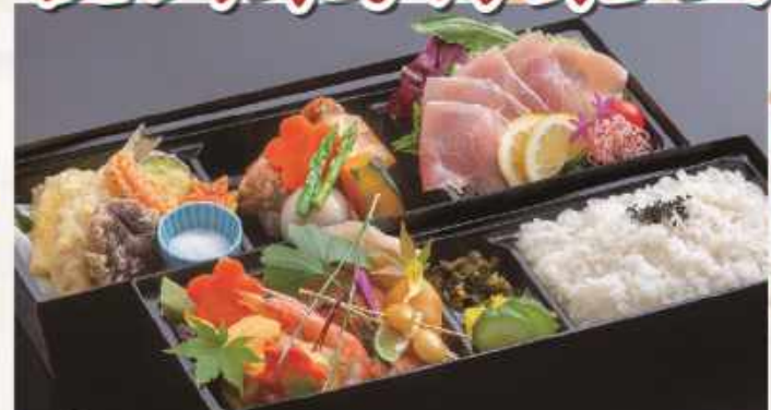
野菜天ぷら・角煮 など 注文No.1 新 松花堂 和風弁当 2,000円