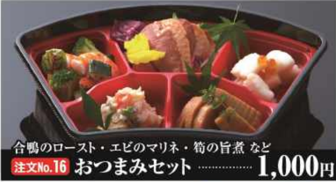
合鴨のロースト・エビのマリネ・筍の旨煮 など 注文No.16 おつまみセット ..... 1,000円