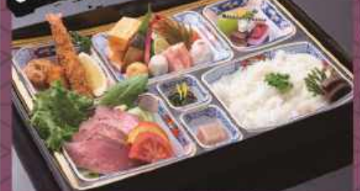
注文No.3 法要弁当 ..... 3,000円