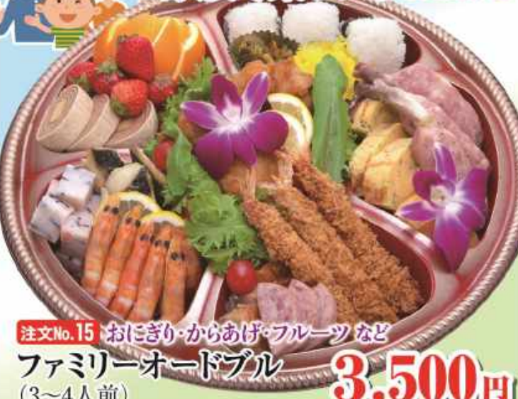
注文No.15 おにぎり・からあげ・フルーツ など ファミリーオードブル (3~4人前) 3,500円