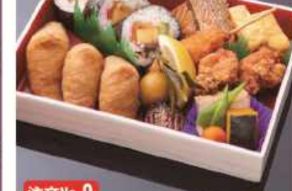
注文No.9 助六弁当 ..... 1,000円

〈メニュー〉 特選牛のステーキ・エビ黄金焼き・エビピラフ・ 生ハムサラダ・デザートなど