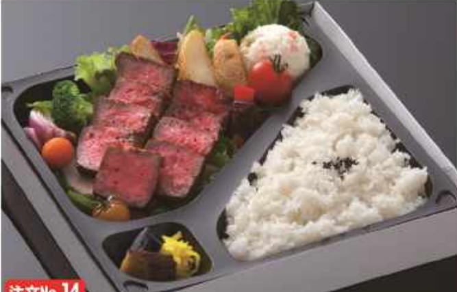
注文No.14 高級黒毛和牛ステーキ弁当 ..... 2,000円