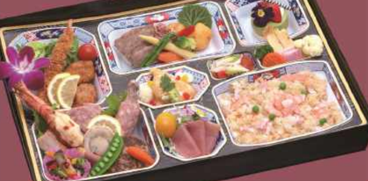
注文No.13 洋食弁当 ..... 3,500円

〈メニュー〉 特選牛のステーキ・エビ黄金焼き・エビピラフ・ 生ハムサラダ・デザートなど