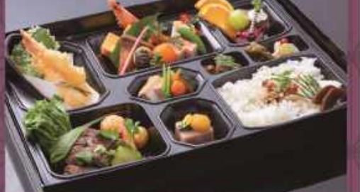
注文No.4 法要弁当 ..... 4,000円